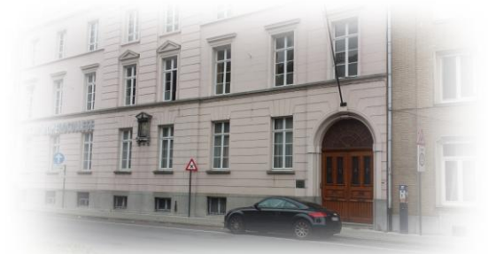
Genealogisch documentatiecentrum "VINCENTIUS"